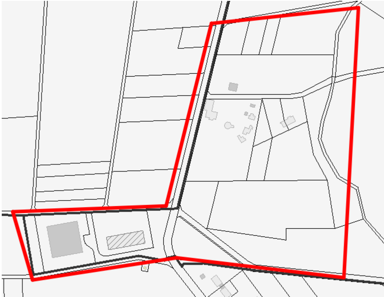
Abrechnungseinheit 2: Eichenpark/Postverteilerzentrum