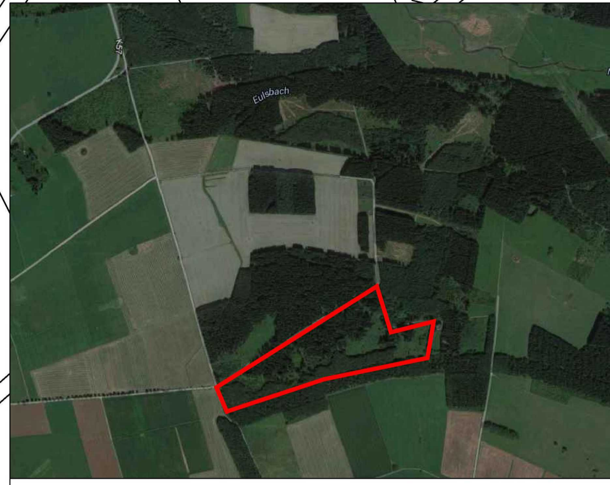
Kompensationsfläche B, 2.1 ha Höhn Oellingen; Flur 41; Flurstücke 1/2, 5, 9